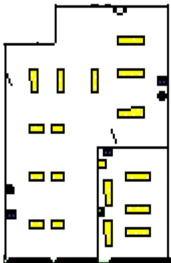
Схема группового помещения

Помещение группы, водоснабжение, канализация, отопление и вентиляция соответствуют санитарно-эпидемиологическим правилам и нормам, а также нормам пожарной и электробезопасности, требованиям охраны воспитанников и работников.